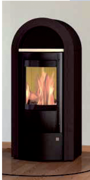
Sotara Compact avec habillage acier