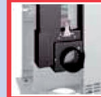
Dispositif d'air secondaire