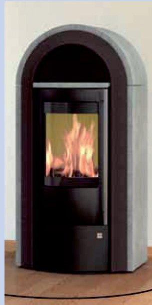
Sotara Compact avec habillage pierre ollaire