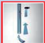
Pognée à circulation d'air